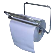
Typ PUTZR ABROLLW