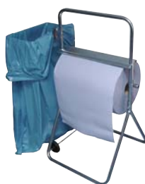
Typ PUTZR ABROLL