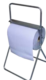
Typ PUTZR ABROLL B