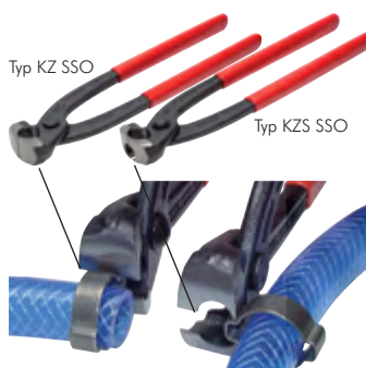
Typ KZ SSO