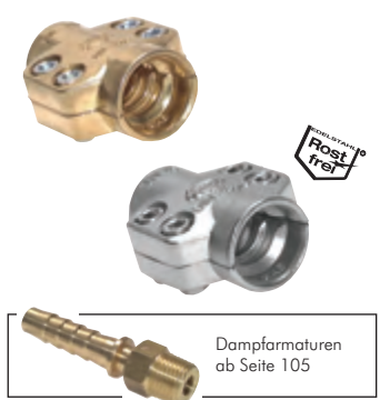
Dampfarmaturen ab Seite 105

Alle Angaben verstehen sich als unverbindliche Richtwerte! Für nicht schriftlich bestätigte Datenauswahl übernehmen wir keine Haftung. Druckangaben beziehen sich, soweit nicht anders angegeben, auf Flüssigkeiten der Gruppe II bei +20°C.