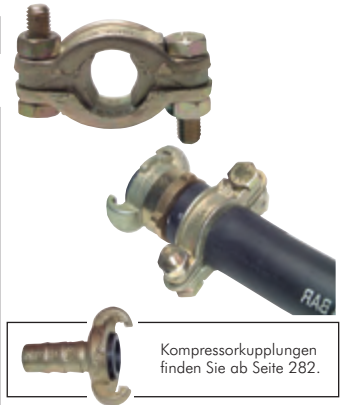
Kompressorkupplungen finden Sie ab Seite 282.