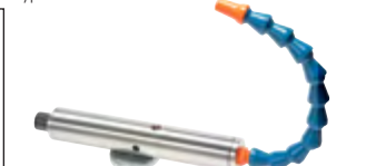
Typ VORTEX 14 KP