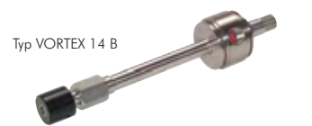
Typ VORTEX 14 B