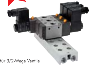
für 3/2-Wege Ventile