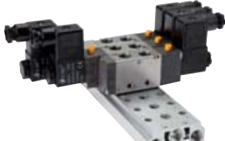
für 5/2-Wege & 5/3-Wege Ventile