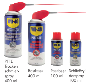
PTFE- Trocken- schmier- spray 400 ml