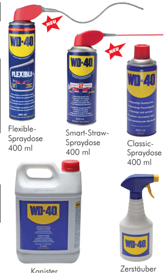
Kanister 5 Liter