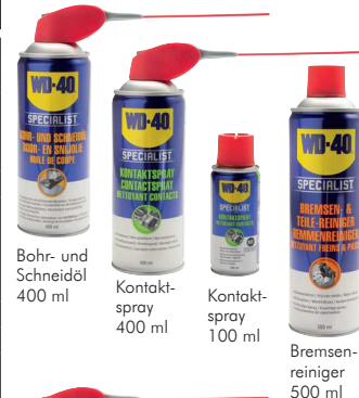
Bohr- und Schneidöl 400 ml