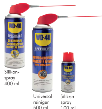
Silikon- spray 400 ml