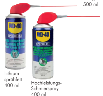
Lithium- sprühfett 400 ml