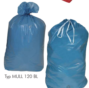
Typ MULL 120 BL