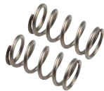
Ersatzfedern für Baugröße 2 & 6