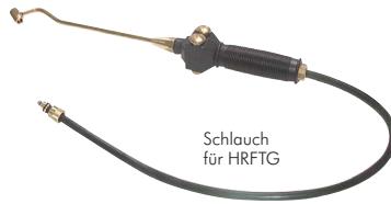
Schlauch für HRFTG