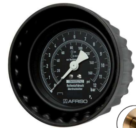
Typ HRFG MANO