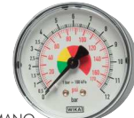
Typ HRFS MANO