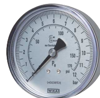
Typ HRFGS MANO