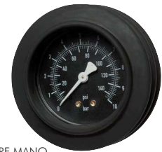
Typ HRF MANO